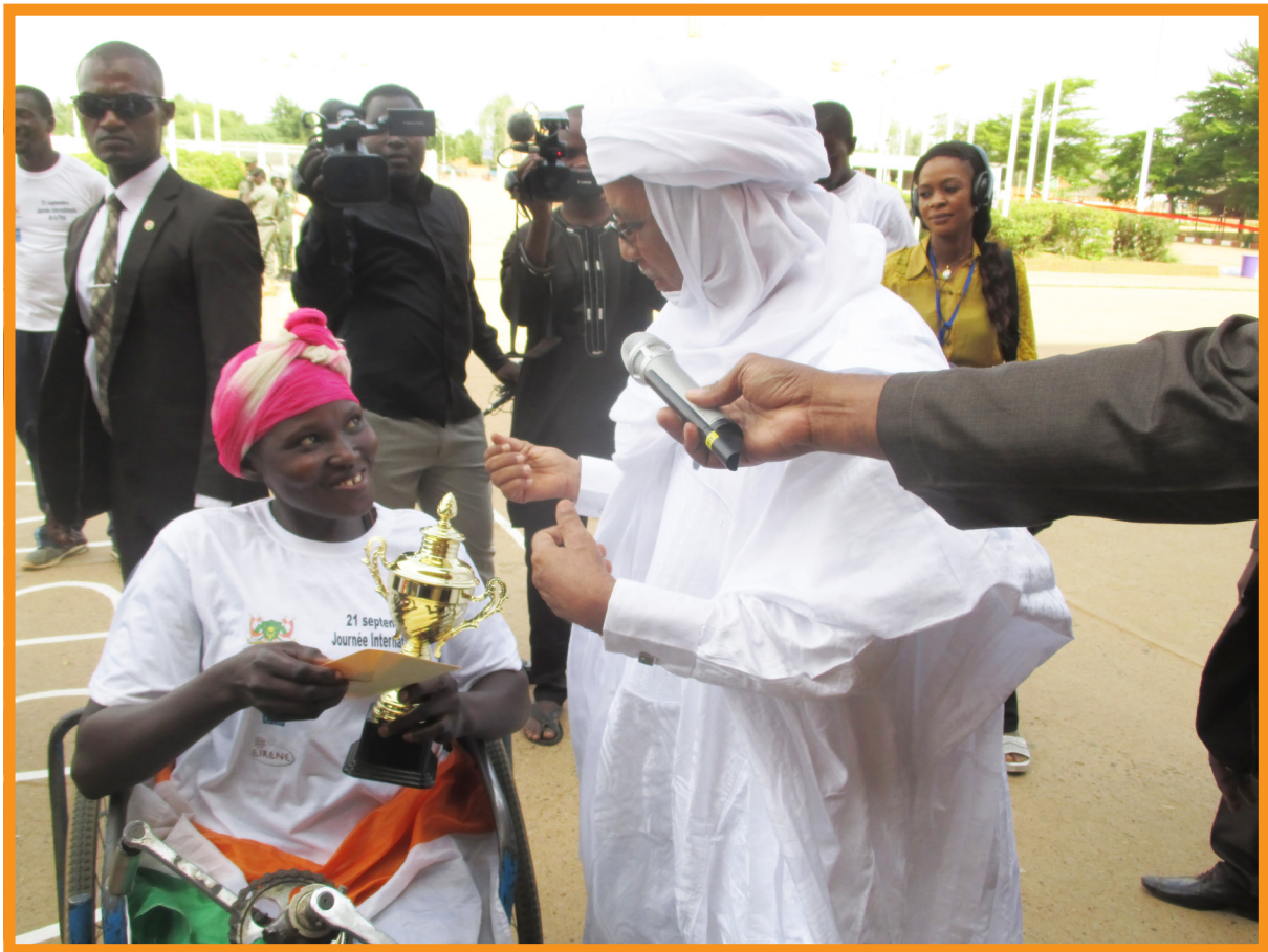
Célébration de la Journée Internationale de la Paix, remise de prix de la course