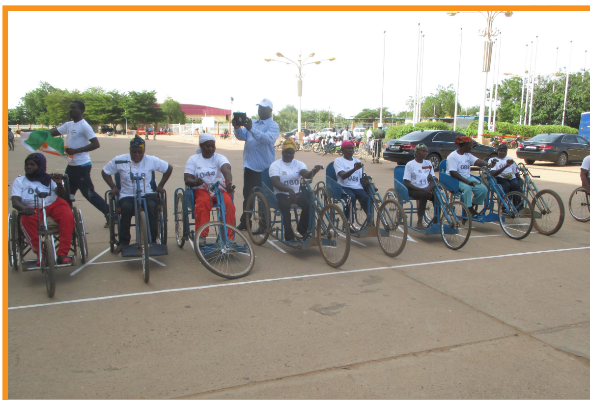
Célébration de la Journée Internationale de la Paix, course des handicapés.