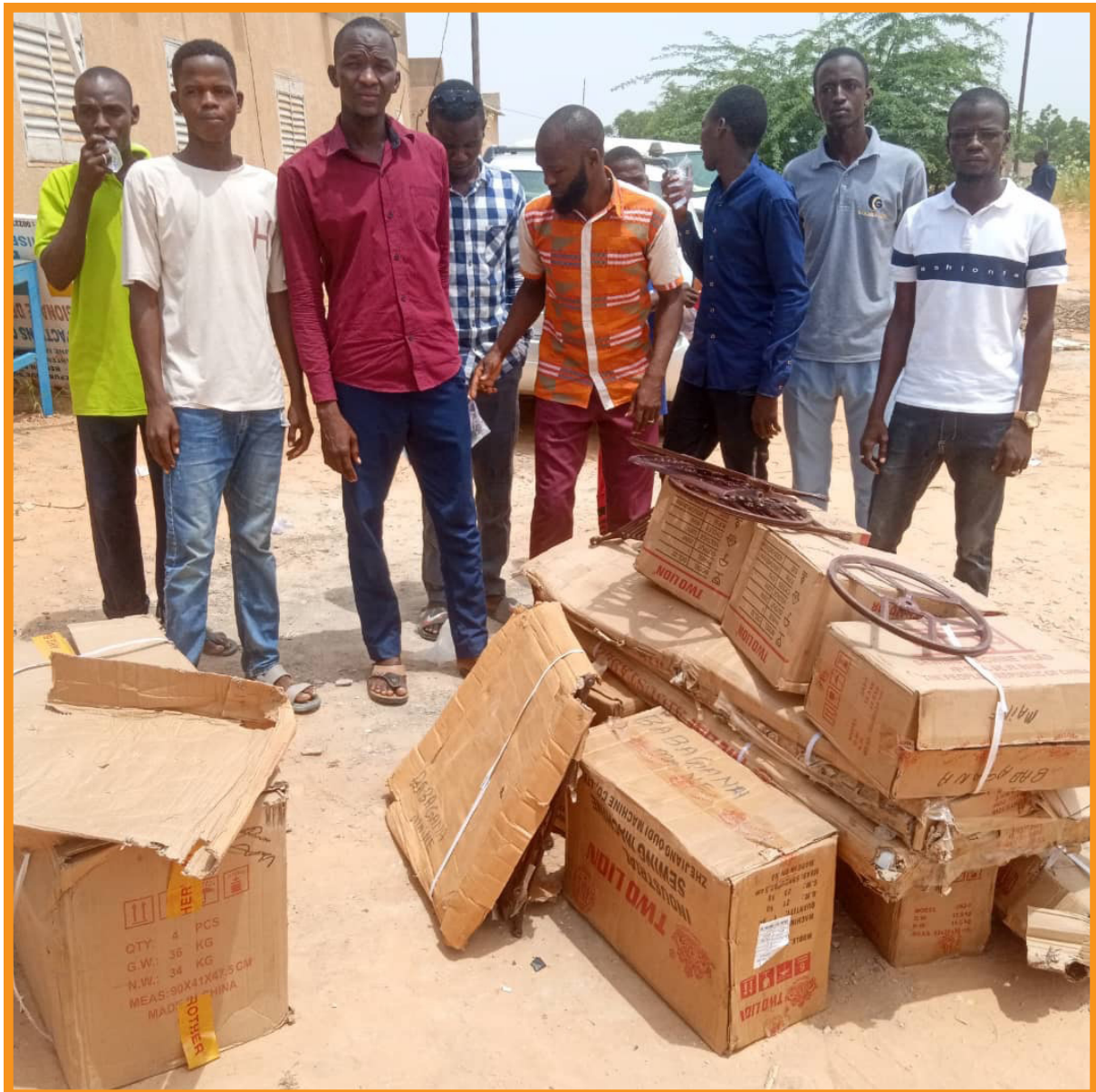
Activité Génératrice de Revenus, dotation des machines à coudre

L'entreprise de contenir la dégradation sécuritaire demande une utilisation graduée et différenciée de la Force Publique et la subordination des autres intervenants à l'action des Forces Armées dans les phases où cette action est hégémonique.