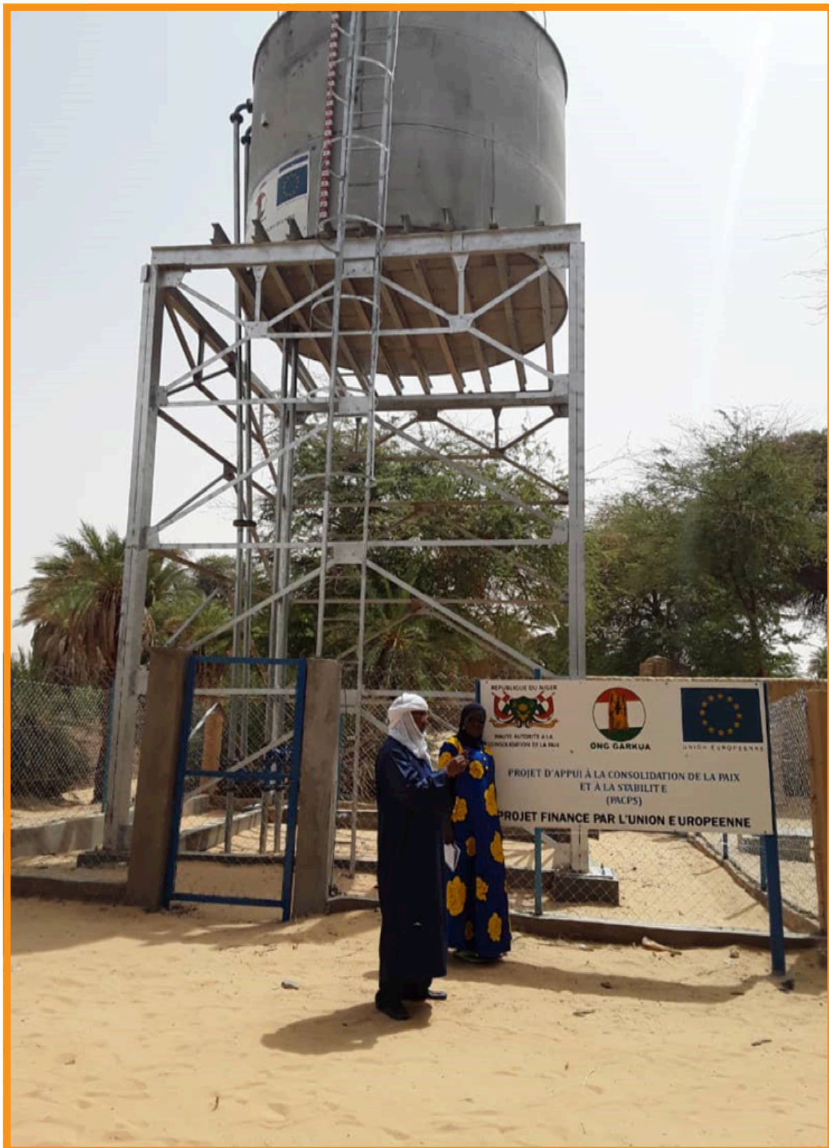
Château d'eau, Bilma