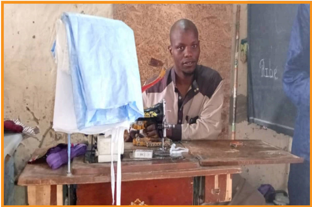
Activité Génératrice de Revenus, Tailleur à N'guigmi

L'OPAPP a donc un champ d'intervention très large qui dépasse les seules zones confrontées aux conflits. Elle place la sécurité humaine au centre de son intervention.