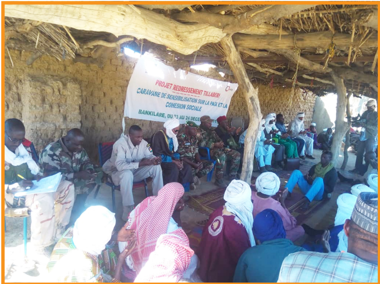
Caravane de la Paix, Bankilaré

De manière générale, la HACP a pour mission de renforcer l'État dans son rôle de rempart à la violence en contenant les conflits dans le domaine du droit et de la négociation politique. Investie d'une telle mission de consolidation de la paix, la HACP n'a pas d'équivalent dans la sous-région 5 .