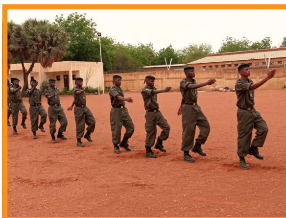
Processus de recrutement et formation de jeunes recrues de la Police Municipale