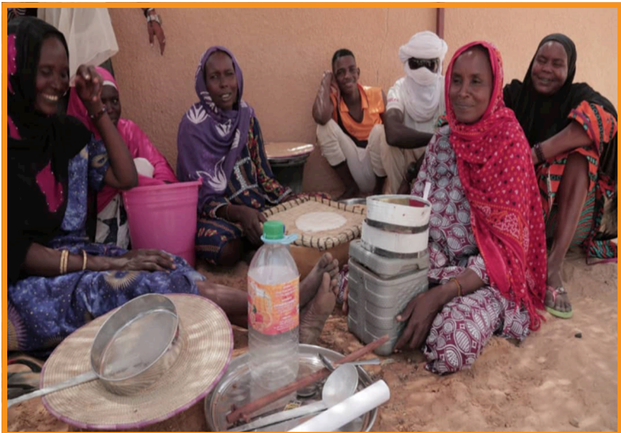
Activité Génératrice de Revenus, dotation de cheptel et fabrication de fromage, Tesker

En matière de planification, la HACP est toutefois en phase d'apprentissage et l'effort doit être consolidé. Le développement de ses capacités techniques et managériales reste une priorité fondamentale, inscrite dans le Plan Stratégique 2019-2021 de l'institution. Mais pour l'heure, les axes de ce développement ne font pas l'objet d'une réflexion murie et structurée.