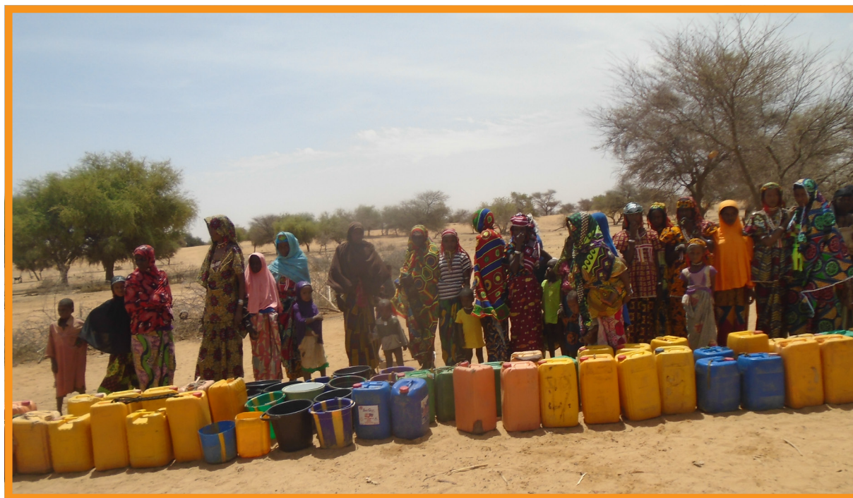
Forage Agay Inates

Par la suite, la question s'est posée à Tillabéry de favoriser le retour de jeunes, majoritairement de la communauté peul, ayant pris les armes à des fins d'autodéfense, parfois en complicité avec les groupes djihadistes. Ce processus a été initié par la HACP au Forum de Banibangou en 2018, s'appuyant principalement sur les chefs traditionnels du nord Tillabéry. Il continue aujourd'hui dans le département d'Ayourou où une dizaine de combattants de l'EIGS ont accepté de déposer les armes et d'aider les Forces Armées dans leurs opérations militaires.